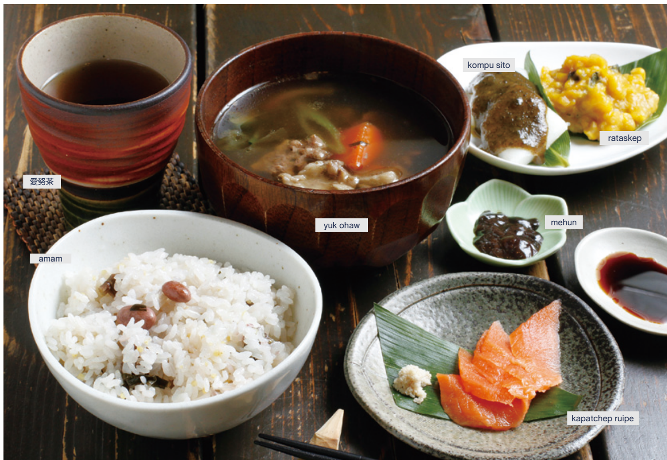
※根據季節的不同提供的飲食會有變化。